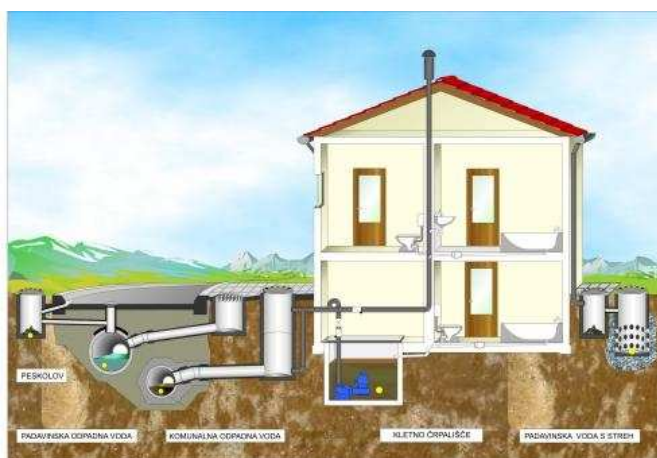
Slika: Primer ureditve odvajanja odp. voda

Strošek priklopa odpadnih vod na jašek javnega kanala, nadzora med gradnjo vključno s končnim pregledom izvedbe hišnega priključka in geodetskega posnetka hišnega priključka krije lastnik objekta po dejansko porabljenem času in materialu.